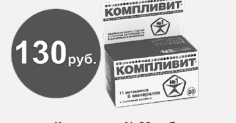
Компливит №60 таб.