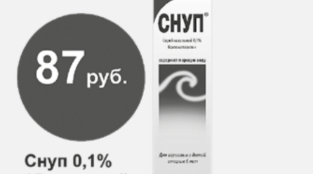
Снуп 0,1% 15 мл спрей