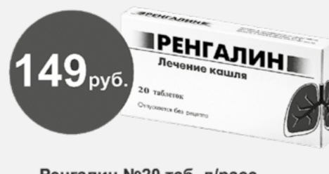
Ренгалин №20 таб. д/расс.