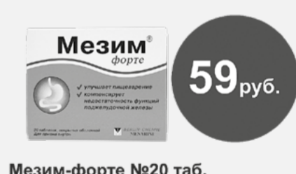
Мезим-форте №20 таб.