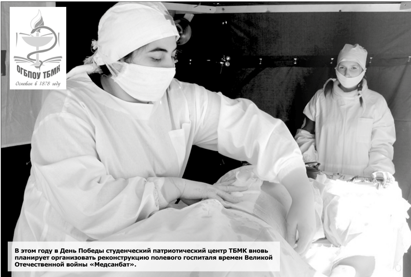
В этом году в День Победы студенческий патриотический центр ТБМК вновь планирует организовать реконструкцию полевого госпиталя времен Великой Отечественной войны «Медсанбат».