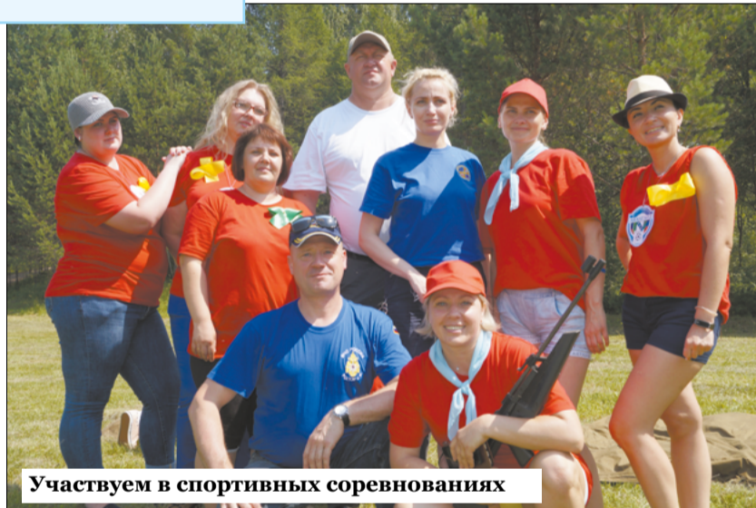
Участвуем в спортивных соревнованиях

ференциях могут все медсестры, только для членов Ассоциации есть определенные льготы, а в свете обязательного непрерывного медицинского образования (НМО) это еще и возможность каждые пять лет набирать необходимые баллы для получения сертификата.