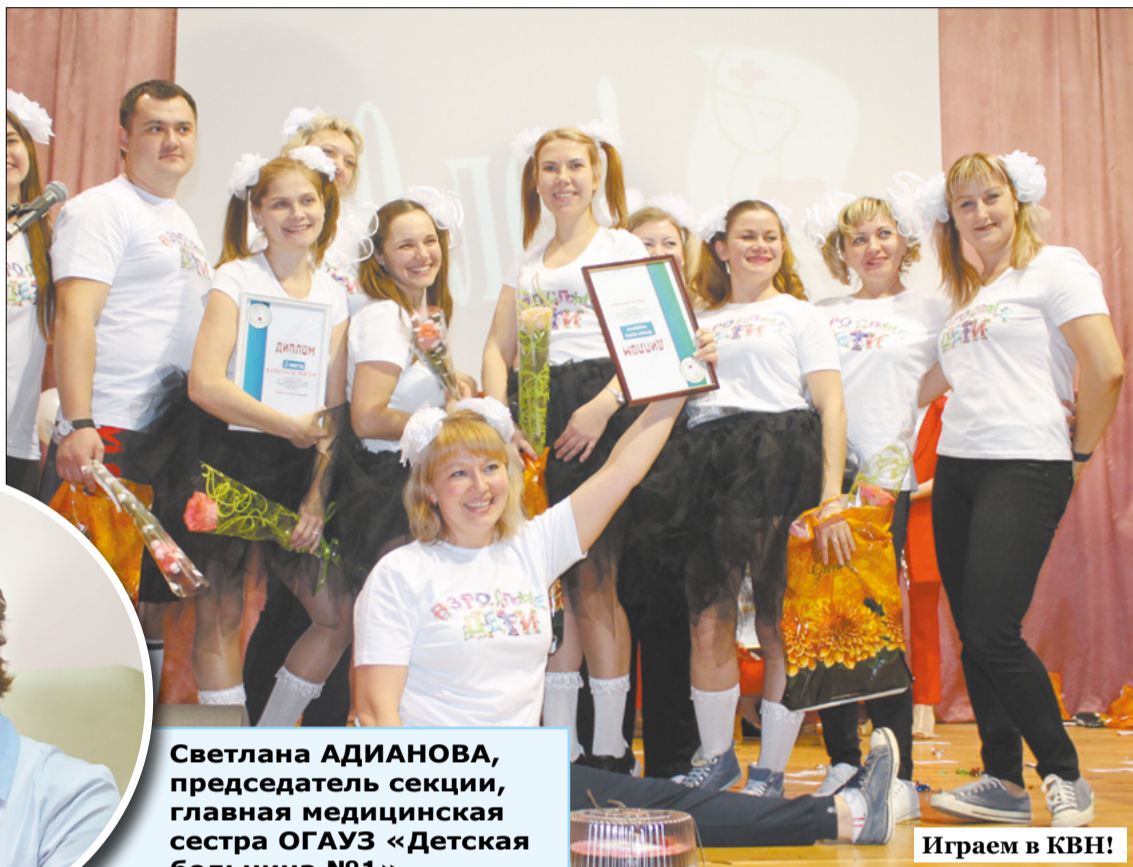
Играем в КВН!