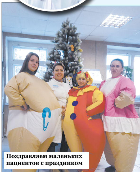
Поздравляем маленьких пациентов с праздником