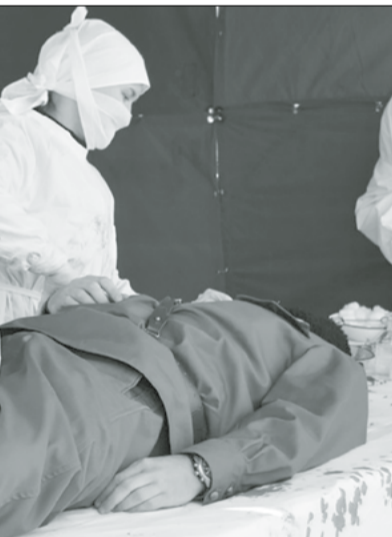
подвиге медицинских работников в годы войны!

В прошлом году на площадке работали 63 студента в три смены.