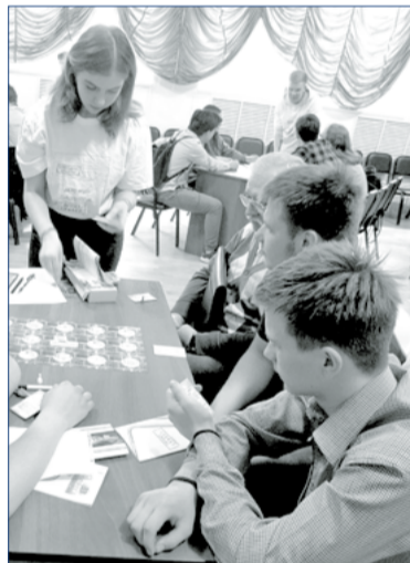
Студенты ссузов играют в настольную игру-квест «Проект С.В.И.П.Е.Р. Лаборатория»

Также в рамках проекта в этом году прошел целый ряд мероприятий: конкурс социальной рекламы, онлайн-квест в соцсети ВКонтакте, видеоакция и большой