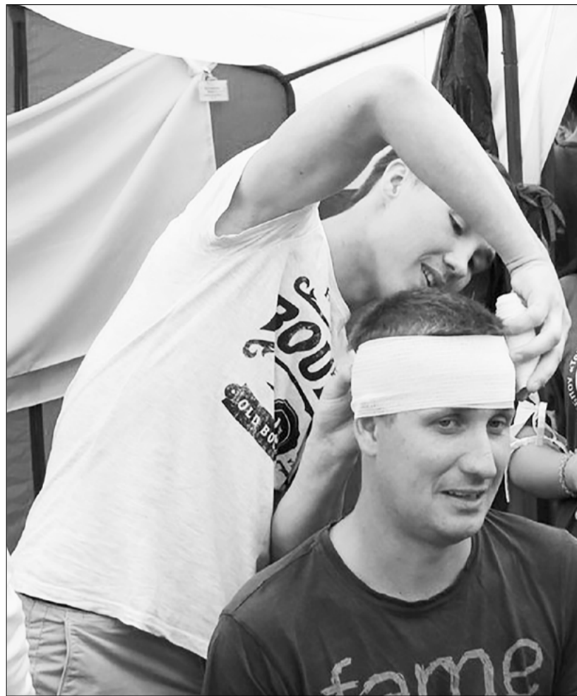
На интерактивной площадке «М-мастерство» в День молодежи медпомощь. Курирует работу площадки руководитель отдела

ТБМК стал постоянной площадкой для реализации проекта томского Центра СПИД – «С.В.И.П.Е.Р.». Он нацелен на профилактику ВИЧ-инфекции, а также на формирование ответственного отношения к своему здоровью и здоровью окружающих. Студенты медколледжа прошли обучение на базе Центра СПИД и стали официальными тренерами-волонтерами проекта.