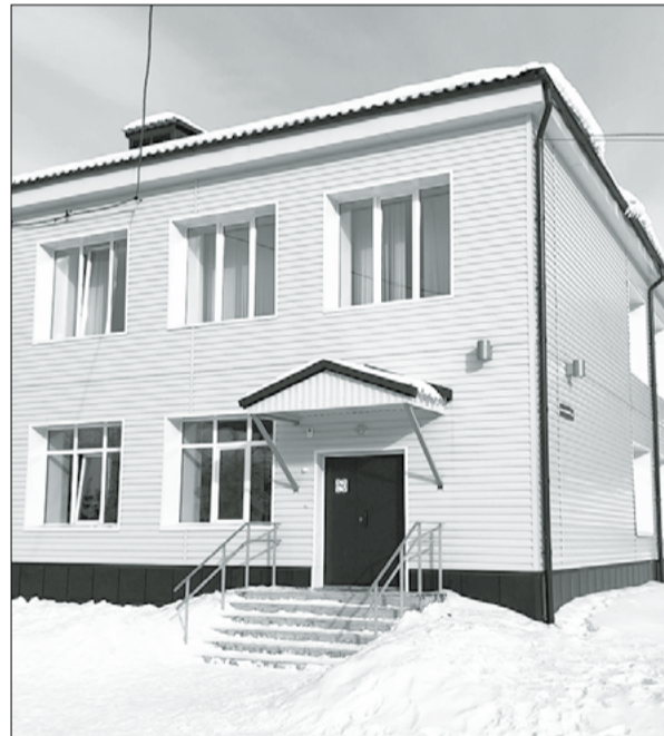
В «Санаторно-лесной школе» фтизиопульмонологический центр провел капитальный ремонт

– Смертность – это важнейший показатель работы любого врача. Мы этим показателем можем по праву гордиться: в 2016 году смертность от туберкулеза у нас составила 3,8 случая, в 2017 году – 3,9 случая, в прошедшем году – 2,7 случая на 100 тыс. населения.