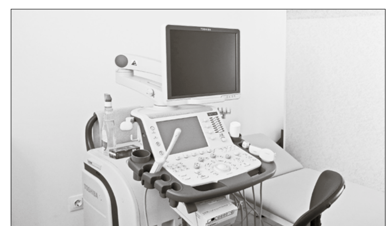
Цифровой УЗ-аппарат TOSHIBA APLIO 500