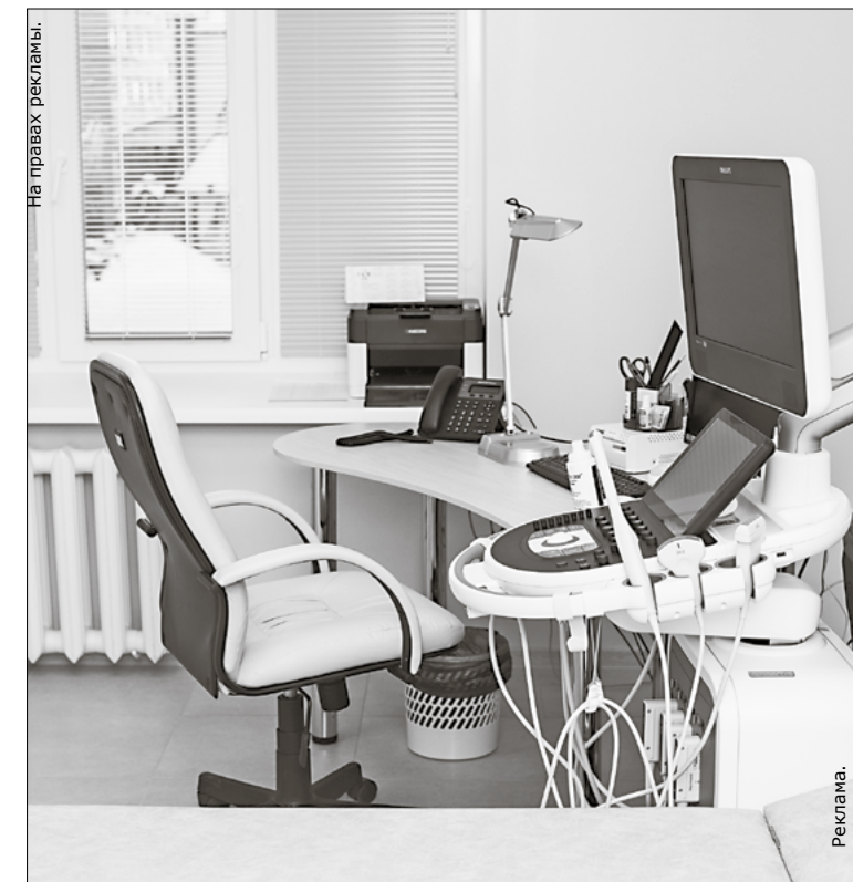
Кабинеты центра оснащены современным оборудованием

«ЦЕНТР РЕПРОДУКТИВНОГО ЗДОРОВЬЯ ДОКТОРА СПИРИНОЙ»: пр. Фрунзе, 39, 2 этаж. Запись по телефону - 8 (3822) 799-200. Сайт: drspirina.ru, e-mail: info@drspirina.ru @reproduktolog_tsk