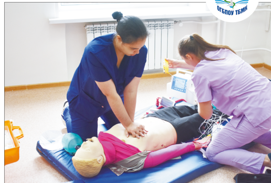
Занятия студентов в мастерской по компетенции «Скорая медицинская помощь»